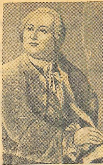
На знімку: М. В. ЛОМОНОСОВ