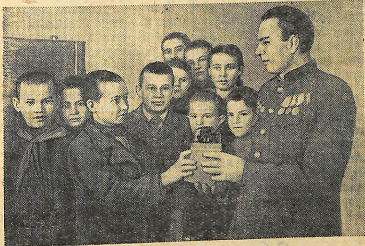
Щороку піонери і школярі знищують велику кількість шкідників колгоспних ланів. Учні Апостолівської семирічної школи, Дніпропетровської області, в 1951 році вилунали на полях колгоспу «Победа» близько трьох тисяч ховрахів, врятувавши цим майже три тисячі пудів хліба. Школярі, що найбільше вилунали ховрахів, були премійовані фотоапаратами, річною підпискою на газету «Піонерська правда».