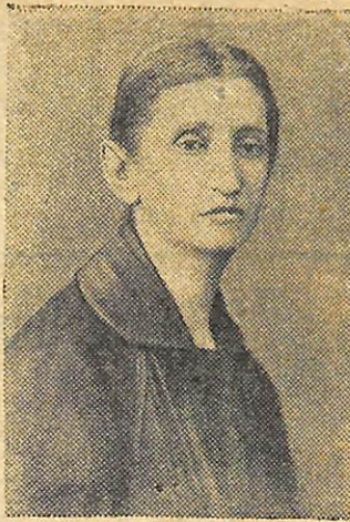
21 березня 1952 року минає 10 років з дня смерті (1942) Ольги Юліанівни КОБИЛЯНСЬКОЇ—видатної української письменниці.

І. БОНДАР, інструктор політвідділу БМУ-2.