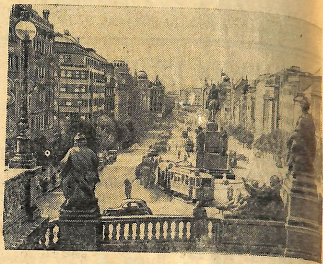
На знімку: Вацлавська площа в місті Празі—столиці чехословацької республіки.

Зосереджена в руках народу чехословацька промисловість, що розвивається за єдиним планом, є найважливішою економічною опорою народно-демократичного ладу в країні.