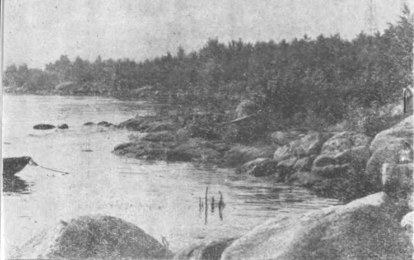
Берег острова Хортица

рокне, чарующие дали Днепра: огромный величавый водный простор, живописные берега. Впереди — огромное море).