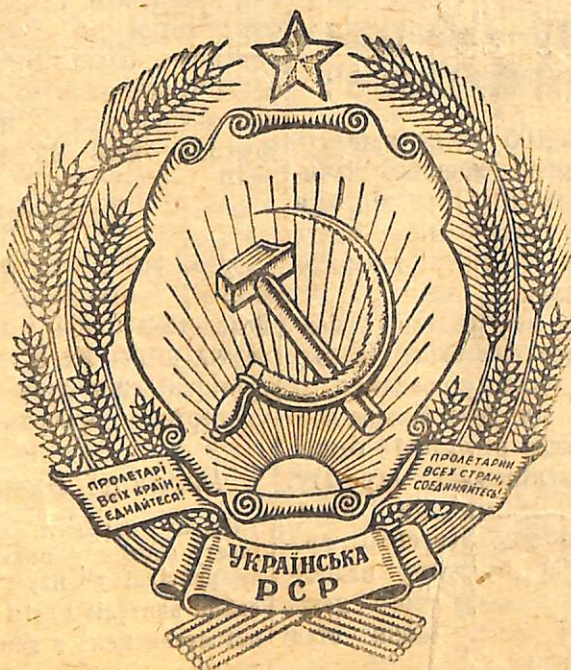
Державний герб Української РСР.