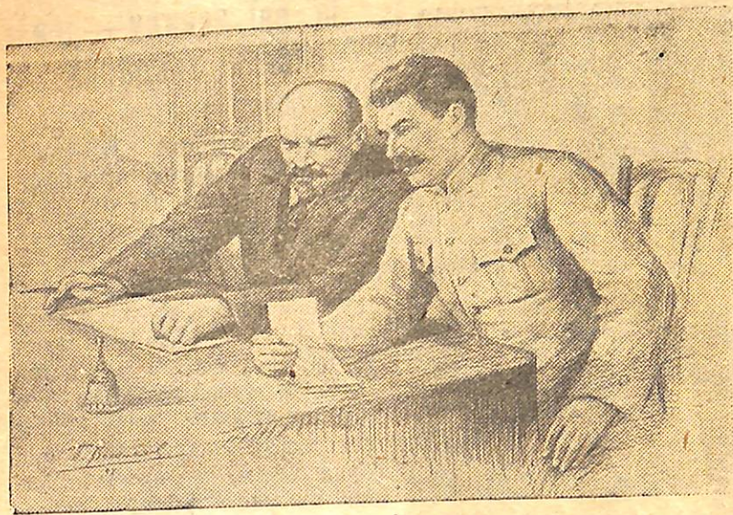
В. І. Ленін та Й. В. Сталін. Малюнок П. Васильєва.