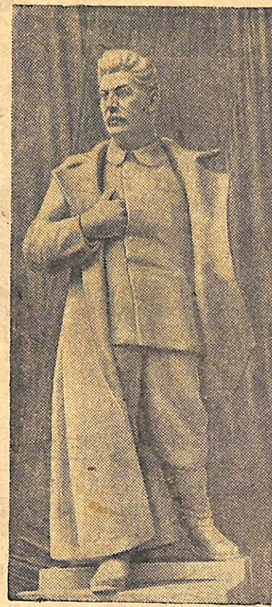
Москва. Центральний музей В. І. Леніна. На знімку: Й. В. Сталін. Монумент роботи Меркурова.