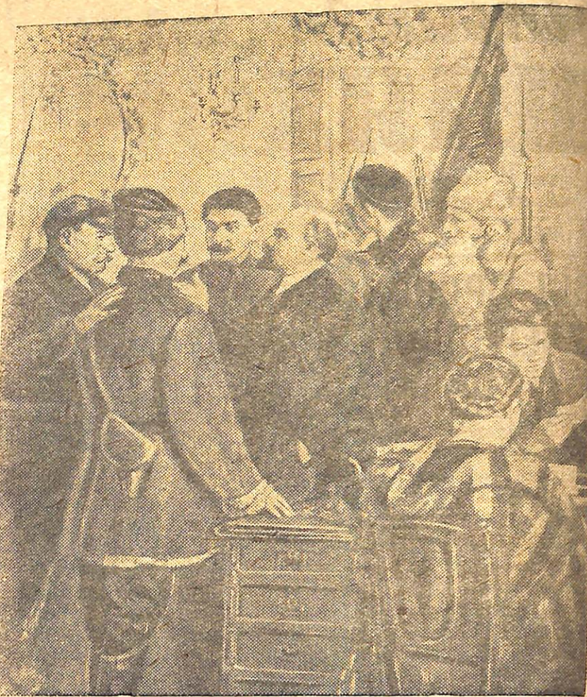
Репродукція з картини художника Б. В. Йогансона.