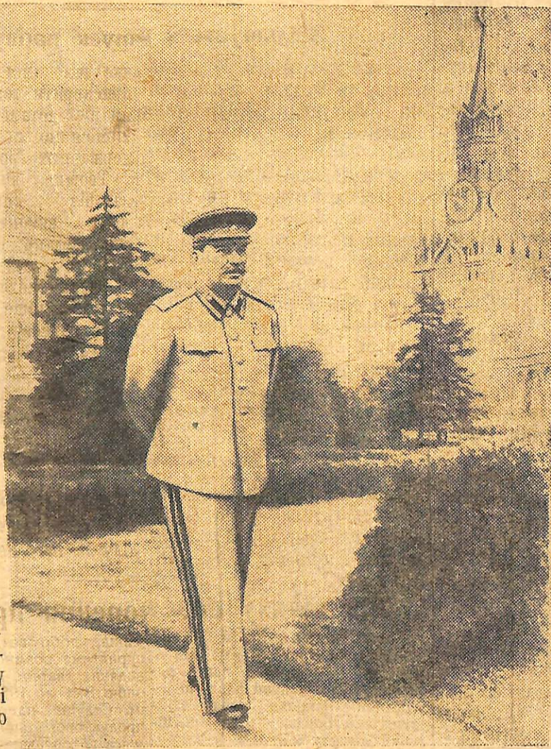
Й. В. СТАЛІН У КРЕМЛІ

Під прапором Леніна, під проводом Сталіна — вперед, до перемоги комунізму!