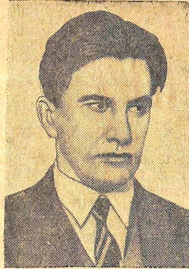
Володимир Володимирович МАЯКОВСЬКИЙ—найталановитіший поет нашої епохи.

Виняткової сили викривання, зривання всіх і всіляких масок з буржуазної Америки Маяковський досягає в геніальному вірші «Небоскреб в разрезе». Він заглядає за розкішний фасад нью-йоркського хмарочоса і бачить там «старейшие норки да коморки—совсем дооктябрьские Елецаль Контотон».