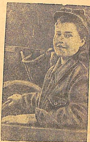
Колектив шахти № 3-4 виконав п'ятирічний план.

У кращому приміщенні флагмана „Слава“ обрладаний агітпункт. Китобой вивчають Конституцію і Положення про вибори. Регулярно провадяться доповіді та бесіди. (РАТАУ).