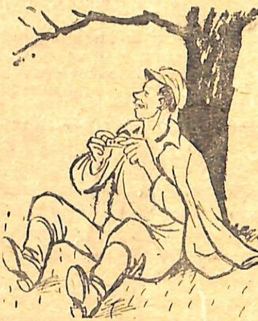
ШУМЕЙКО:—Робота не вовк, в ліс не втече.