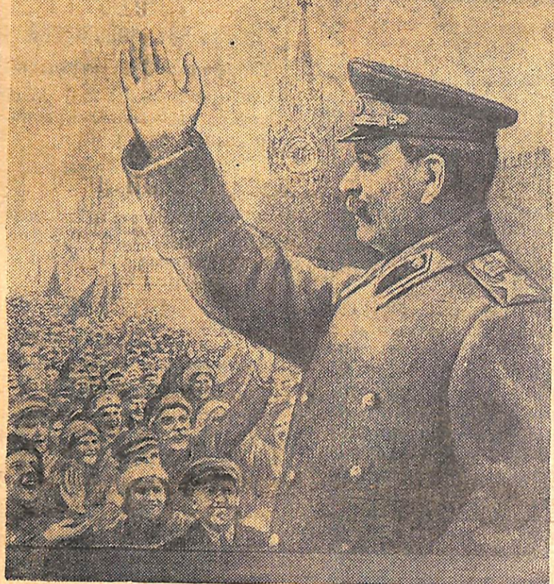
Мал. А. Резніченка.