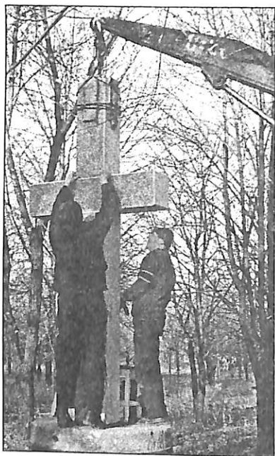
№ 46. Встановлення хреста