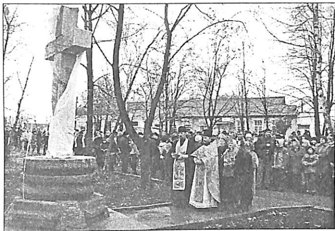
№ 48-49. Відкриття пам'ятника 22 листопада 2008 року.