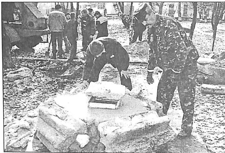
№ 45. Укладання котків